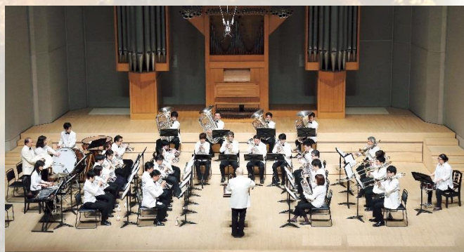
東京ブラスコンコード