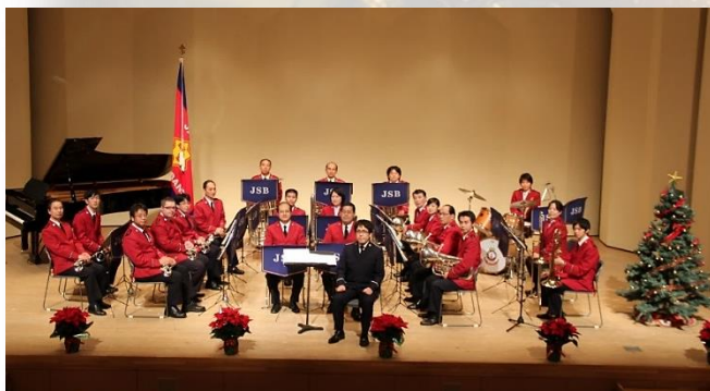
救世軍ジャパン・スタッフ・バンド